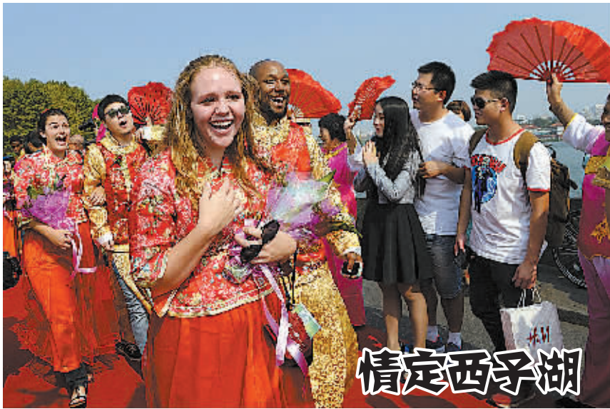
10月6日,在杭州西湖白堤,参加集体婚礼的新人走在红地毯铺成的“玫瑰大道”上。 当日,中国及来自美国、法国、德国、意大利、赞比亚、巴基斯坦等19个国家的100对新人参加在浙江省杭州市举办的2014“玫瑰婚典”。他们身着中国传统服饰,在集体婚礼中泛舟西湖,情定西子湖畔。

新华社天津10月6日电(记者周润健)10月8日,我国观测条件非常好的一次月全食将现身天宇。如果天气晴好,对此次天文奇观该如何观赏?怎样才能拍摄出效果绝佳的“月食葫芦串”?如何与“红月亮”合影?针对这些问题,记者采访了相关天文专家。 喜欢天体摄影的公众,可提前准备好相机,数码相机或胶片的都可以,来一张与“红月亮”带地景的特色合影,名胜古迹、标志性建筑物都是很好的素材。如果想拍摄近处人物与月全食的合影的话,可以适当使用闪光灯补光。 专家称,要想拍摄“月食葫芦串”,需选用能连续在同一幅画面中多次曝光的相机,并准备好三脚架来固定相机,每隔15分钟左右拍一次,就可以得到“月食葫芦串”的独特效果。当然也可以采用后期叠加的处理方法,把月全食的全过程呈现在一张照片上。 观看月全食,最好能使用带三脚架的能放大几十倍的天文望远镜。有兴趣的公众可到所在地的天文学会或天文馆、科技馆。为了迎接这次月全食,这些场所都会在当天组织市民用专业天文望远镜进行观测。 驾驶员郭先生说,他打算把船从东阳拖到杭州,就把船固定在轿车后方。虽然造型很诡异,但高速公路对小型客车免费通行,收费处并没有杆子拦着,郭先生就直接开了上去。 高速交警发现,在船只后方,只有一块三角牌具有反光效果,并没有其他具有提示功能的设施。夜间行驶,船只已经完全遮挡了汽车尾部转向灯、刹车灯和示宽灯,存在很大的安全隐患。