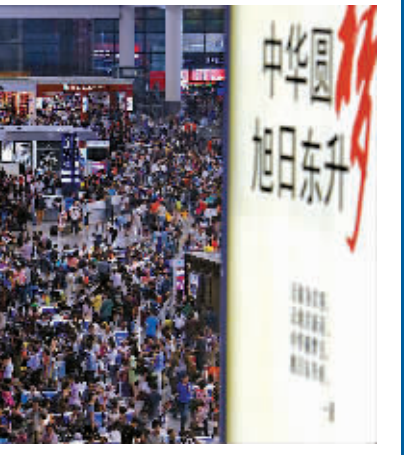
10月6日,旅客在上海虹桥火车站候车大厅等候进站。 上海铁路当日预计发送旅客28.5万人次,总计加开31对临客,主要集中在中短途。

次,其中增加航班90余班次;预计全天客流量约24.6万,同比增长超过3%。预计客流高峰将持续至7日到8日。7日南航计划增加航班100余班,8日计划增加40余班。主要集中在广州往返海口、三亚、武汉、长沙、宜昌等地,深圳往返海口、三亚等地。 重庆市旅游局6日发出提示,请国内外游客特别是自驾游游客返程时注意交通安全。由于民航交通易受天气等因素影响,特别提示旅客在航班出现延误时遵守法律法规、放平心态、合理维权。