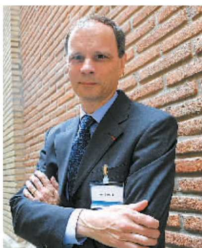
图为法国经济学家让·梯若尔的资料照片(2008年6月2日摄)。

新华社斯德哥尔摩10月13日电(记者付一鸣 和苗)瑞典皇家科学院13日宣布,将2014年诺贝尔经济学奖授予法国经济学家让·梯若尔,以表彰他在研究市场力量与调控方面的贡献。诺贝尔经济学奖评选委员会发表声明说,梯若尔是当今具有世界影响力的经济学家之一,他在经济学很多方面取得了理论研究成果,其中最重要的就是如何理解与规范存在少数大企业的行业。声明说,梯若尔认为,最佳的调控和监督政策应该谨慎地根据不同行业的特殊情况加以实施。梯若尔在一系列学术文章和著作中为相关政策的设计提出了整体框架,并将其应用到从电信到银行等不同的行业中。凭借这些新的经济学研究成果,政府可以更好地促使有实力的大企业提高效率,同时防止其损害竞争对手和客户权益。梯若尔通过现场电话连线表达了自己得知获奖后的激动之情。他随后向媒体表示,他对获奖感到极为惊讶,并立即与妻子和母亲分享了好消息。“她(梯若尔的母亲)90岁了。我告诉她这个消息之前,得先请她坐下来。”梯若尔说。梯若尔在回答新华社记者关于全球银行业监管的问题时说:“政府应该做更多,尤其要重视涉及银行业流通性的法规政策。”他强调,法规政策的力度应尽可能轻到不削弱银