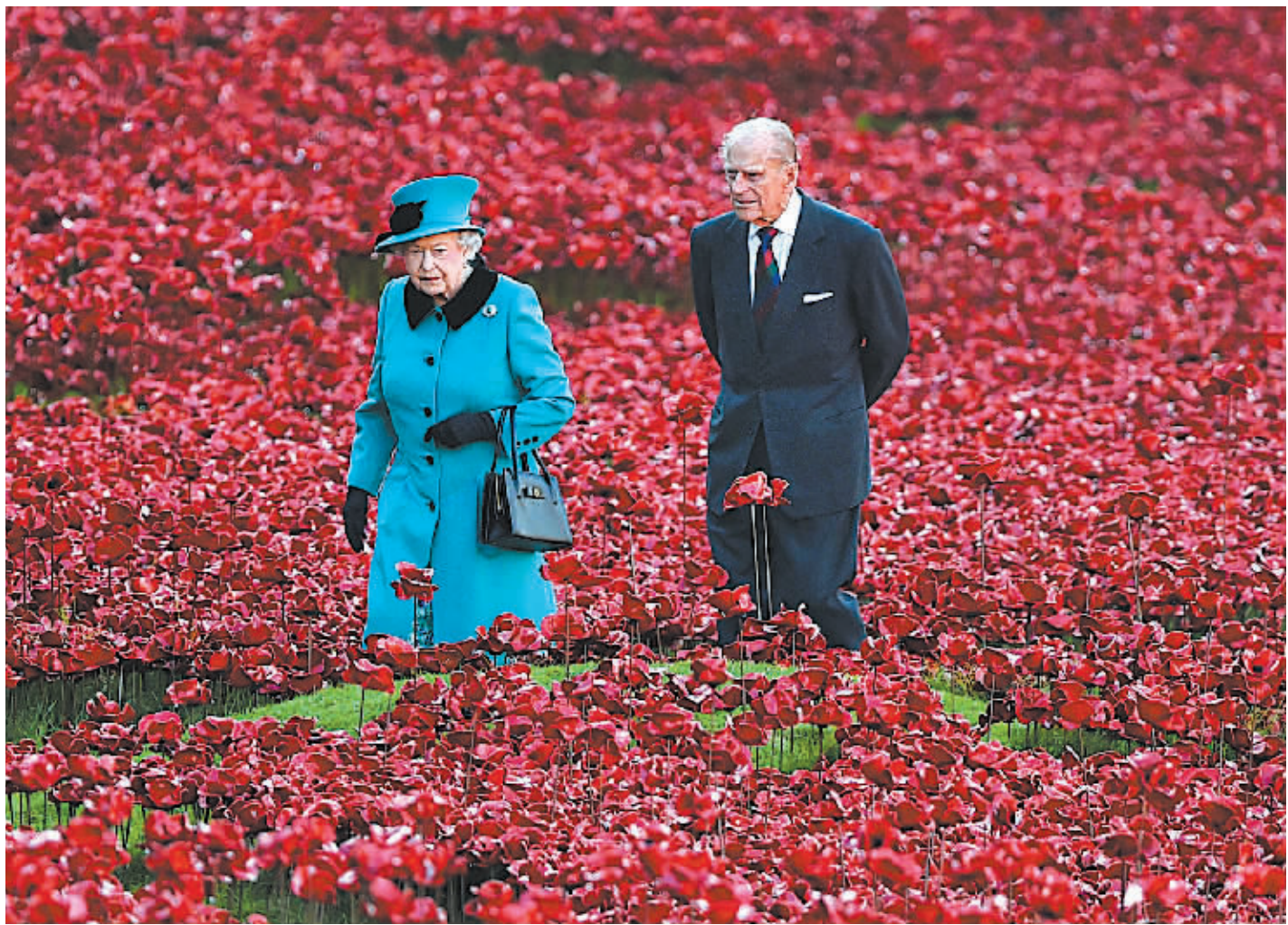
10月16日，在英国伦敦的伦敦塔，英国女王伊丽莎白二世和菲利普亲王在陶瓷制粟花艺术品中穿行。这些陶瓷粟花为迎接在英国举行的纪念第一次世界大战一百周年而制。

法院经审理查明，2003年至2011年间，被告人苏顺虎先后利用担任原铁道部运输局营运部货运营销计划处处长、营运部副主任、副局长兼营运部主任的职务便利，分别接受山西省曲沃县闽光焦化有限责任公司总经理张某某、江西省中创投资有限公司实际控制人周某、北京市铁润商贸有限公司法定代表人段某的请托，为上述三家公司谋取利益，并收受三人给予的款物折合人民币2400余万元。案发后，受贿款物已全部被追缴。