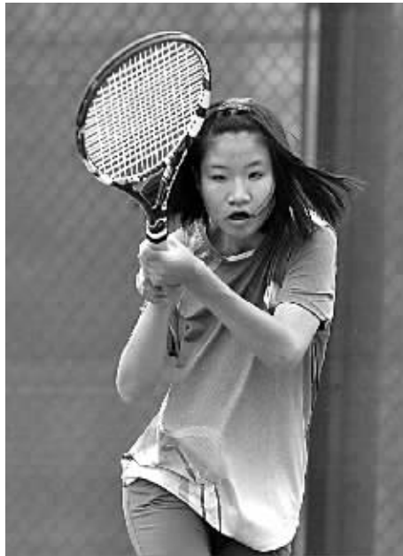
图为宁波网球选手在比赛中的镜头。