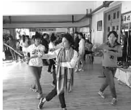
近日,宁波小百花越剧团走进天津大学,与这里的越迷进行了交流,大学生现场跟着演员们学起了动作,一招一式颇有几分范儿。学生们纷纷表示,很喜欢小百花的演出,能得到演员们的指导,觉得“太幸福”了。