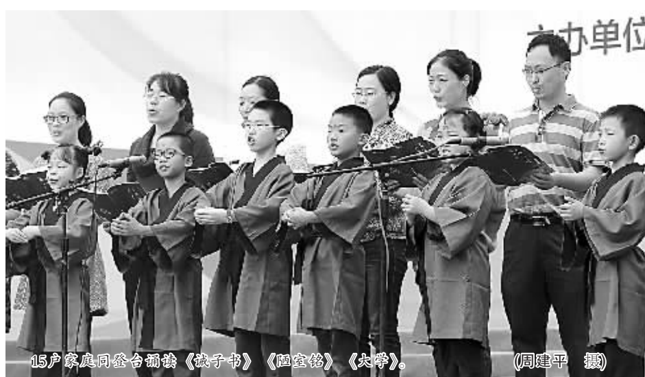
15户家庭同台诵读《诫子书》《陋室铭》《大学》。

为了弘扬中华民族家庭美德,树立良好家风,促进全社会文明程度的提高,今年4月份起海曙区委宣传部、区妇联、区文明办共同发起了寻找“最美家庭”活动。通过家庭自荐、邻里互荐和社区妇联组织推荐等多种形式,并经网络公示、网民投票,最终评