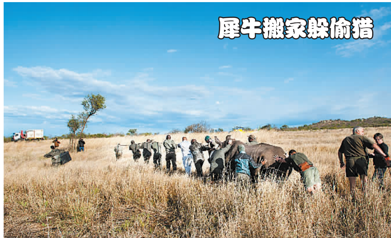
10月17日，在南非克魯格国家公园，工作人员将犀牛牵引至转运车辆。当日，南非克魯格国家公园将四头犀牛从偷猎高风险地区迁移至较为安全的新家。