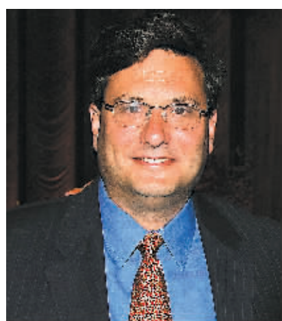
罗恩·克莱因的资料照片。

这名官员在内的15名活动主办方和赞助方相关人员，当地时间18日清晨7时许，这名官员被发现死于事故发生地不远的促进会大楼旁街道上。韩联社报道，警方没有在死者身上发现遗言，但有报道称他曾在社交网站上留言，称“我向遇难者道歉，我对不起家人”。监控视频显示，这名官员通过逃生通道登上10层楼的楼顶。京畿道城南市政府发言人在18日的记者会上说，11名伤者中8人伤势危重，这起事故的死亡人数可能进一步上升。