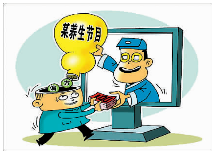
养“生意” 朱慧卿 作

16日16时48分，河南卫视播出“健康就好”节目。主讲人王涛博士在节目中声称，糖尿病根本上是肝脏有问题，糖尿病可以通过摄取营养素来调理治疗。资料显示，自2012年开播以来，这档节目已在江西、云南、四川、青海等10多家卫视播出过。尽管其“营养调理”理论是否科学有待论证，但该节目的营销目的却显露无疑。该节目中不时播出提示：报名可以接受王涛博士远程调理，栏目热线“4001-899-899”。记者拨打该热线，发现是“健康就好”王博士吉林服务中心。客服人员说，节目在各电视频道播出时留的热线电话不一样，但都会接入位于吉林省吉林市的服务中心。“客户接受营养调理，先要加入会员，每年收360元的服务费和调理方案费；营养素目前由服务中心统一订购，厂家直接发货。”这位客服人员说，因为营养素来自10多个厂家，统一订购是为方便会员、保证质量。记者调查发现，类似的养生节目屡见不鲜。某些时候的下午时段，地面频道则更多。节目大多采用健康讲座、专家咨询的方式传授所谓养生知识，然后穿插蜂蜜、天山雪莲、花粉等各式各样的产品介绍。一位业内人士透露，目前不少