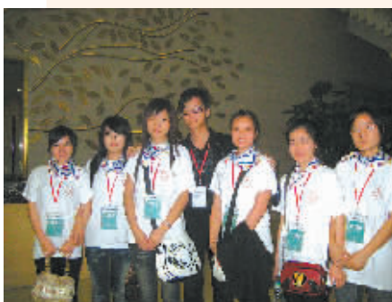
志愿者是国际声乐比赛上一道亮丽的风景线