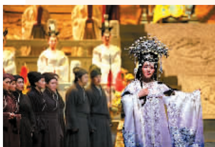
第五届中国国际声乐比赛上演出歌剧《图兰朵》