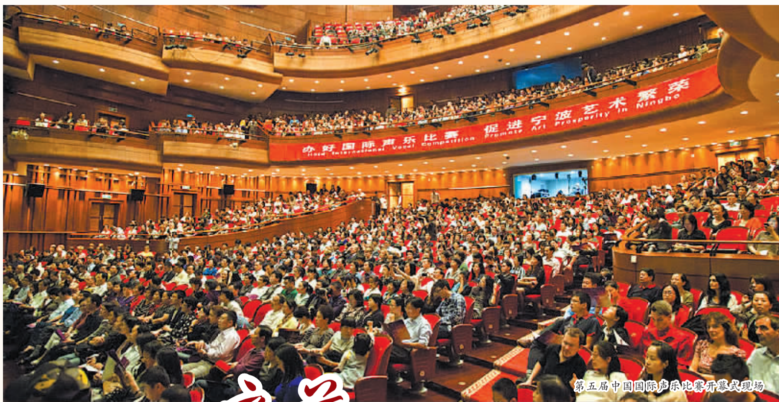
第五届中国国际声乐比赛开幕式现场

为切实加强对中国国际声乐比赛(宁波)的领导,成立了第六届中国国际声乐比赛组织委员会,由文化部部长蔡武任主席,文化部副部长丁伟、宁波市市长卢子跃任副主席,卢子跃市长同时兼任组委会主任。组委会办公室设在市文化广电新闻出版局。在文化部的悉心指导和组委会的精心组织下,宁波市人民政府按照大赛规程,积极动员宣传部、外办、财政局、卫生局、公安局、接待办、团市委、市场监管局、广电集团、报业集团等各方面力量,成立了由市领导亲自挂帅的承办工作领导小组,下设办公室、宣传秘书组、赛事组和综合组,具体负责比赛的各项筹备和实施工作。组委会办公室协同各工作部积极行动,分工合作,统筹协调,形成了筹备工作的合力。全市上下各部门从战略和全局的高度,充分认识办好国际声乐比赛的重要性,统一思想,坚定信心,以高度的责任感和使命感,集中精力,集中力量,扎实做好各项筹备工作。