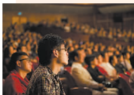
精彩演出给宁波市民带来高雅的艺术享受