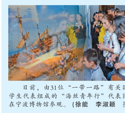
日前,由31位“一带一路”有关国家留学生代表组成的“海丝青年行”代表团团员在宁波博物馆参观。

在打造纳税服务“升级版”的同时,我市税务系统多项纳税服务已经走在全国前列。比如,办理节约能源、使用新能源的车船税减免,国家税务总局要求为“核准”,而我市地税等部门开发了“车船税信息共享平台”,纳税人投保时可实现自动备案,无需到税务机关办理。办理“增值税一般纳税人认定”等业务,国税总局规定时限为20天,在我市国税部门可以“即日即办”。据统计,目前全市税务系统纳税服务升级版的“即日即办”事项已占全部业务的84%,比“国标”高出11个百分点。