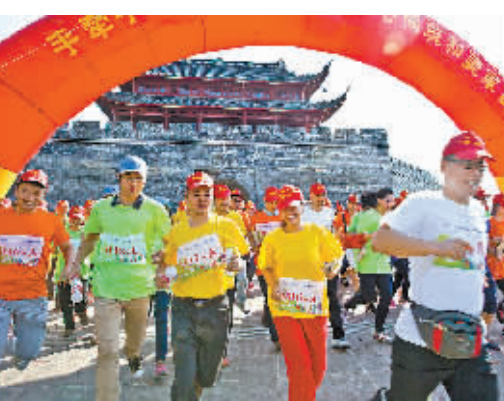
图为定向挑战赛出发时的场景。

本报讯(记者余方觉 宁海记者站陈云松)昨天上午,宁海首届“平安达人”城市徒步定向挑战赛举行。655名公开报名参赛的队员从宁海西门城楼广场出发,至潘天寿广场结束,在8公里的赛程中先后要完成寻找平安宣传字条、平安创建知识问答、平安通关小游戏等7个任务。 城市徒步定向挑战赛起源于瑞典,已有近百年的历史。此次活动期间,宁海县还成立了宁海青年应急救援队和平安百事通志愿服务总队。