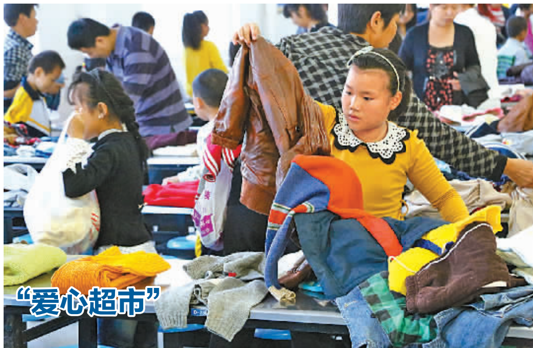
昨天上午，大榭第一小学开展了“提倡节俭，旧衣新穿”的捐赠衣物奉献爱心活动，得到师生们的热烈响应。一周时间，学校大队部陆续收到了5000余件衣服和几百双鞋子。上午8时半，“爱心超市”开放，400多名学生和家有序进入“超市”。短短30分钟，5000余件衣服和几百双鞋子已所剩无几。据了解，该校60%左右的学生系外来务工人员子女，不少来自四川、贵州、安徽等偏远贫困地区。校方希望活动在帮助困难学生的同时，对孩子也有正面教育作用。

住着一个盲人亲戚，5个人如今全靠这位盲人亲戚的退休金生活。 据陈士芳的儿子说，国庆节前的一个晚上，他父亲突然感觉身体不适，家人以为是痛风发作，就让他吃了药躺在床上休息。没想到，第二天，陈士芳的病更严重了，家人赶紧拿出仅有的4000多元积蓄，送他去住院。经检查，陈士芳被确诊患了脑梗塞，并因此导致右半身瘫痪。如果不想让病情继续恶化的话，需住院治疗。因家境贫困，一家人产生了放弃治疗的念头。 就在一家人心灰意冷时，消息传扬开来，村民们纷纷慷慨解囊伸出援手。三天时间，在村委会和街道联村干部的配合帮助下，村民们共为陈士芳筹集了1.5万元医疗费，以帮助他留在医院继续接受治疗。据了解，前天仍有村民在捐款，希望陈家早点从困境中走出来。