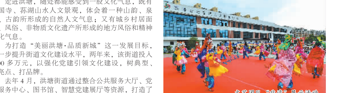
文艺团队“唱响”展示活动

精神家园，洪塘扎实推进农村文化礼堂建设，通过因地制宜建礼堂、量身定做用礼堂、因需选材管礼堂的模式，把文化礼堂建成百姓舞台，为居民提供共享文化资源，传承传统文化的阵地。