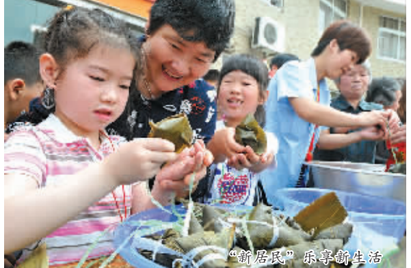
幸福转身 幸福新生活

成为股东后，每年都有股份分红，但为了让更多人重新就业，该街道通过开展就业培训、举办招聘会等形式，引导被征地农民适应新生活。通过加快创业帮扶、推行“两权一房”抵押贷款等措施，一些被征地农民办工厂、开小店，实现了自主创业。