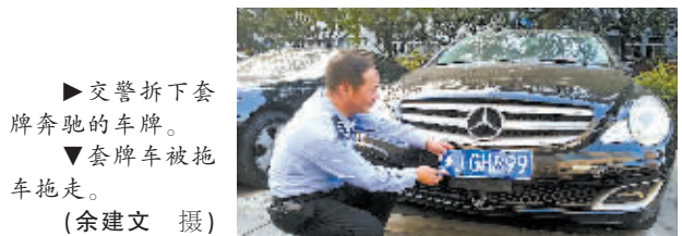
▲交警拆下套牌奔驰的车牌。▼套牌车被拖走。