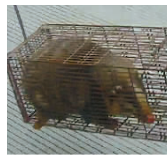
图为被群众发现的猪獾。

据森林公安介绍,该动物的学名叫猪獾,是鼬科猪獾属的中型哺乳动物,体长可达70厘米,毛褐色,身体粗壮,喉部白色,面部有两条黑色的条纹。猪獾主要分布于南亚的热带雨林中,与獾相似,身体略小,前爪则更大,利于捕食。猪獾是杂食性动物,在夜间活动,主要以植株、水果、根和动物的肉为食。如遇危险,猪獾性情凶猛,叫声似猪。据悉,该物种已被列入《国家保护的有益的或者具有重要经济、科学研究价值的陆生野生动物名录》。