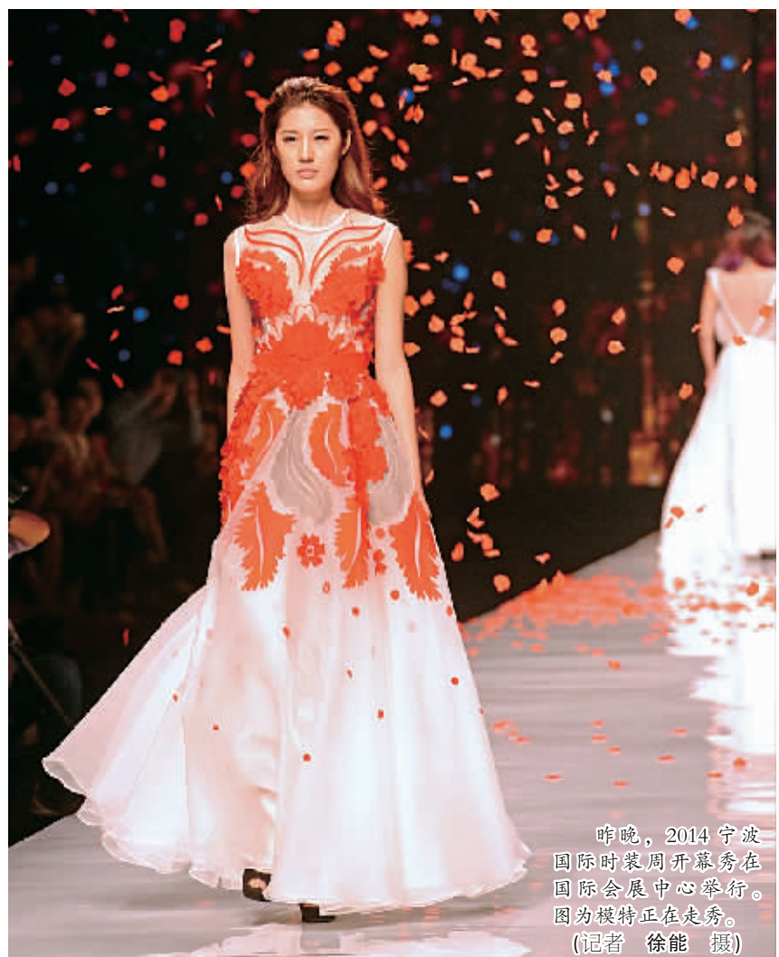
昨晚，2014宁波国际时装周开幕秀在国际会展中心举行。图为模特正在走秀。

本报讯（记者易鹤 通讯员徐蕊）第十八届宁波国际服装节今天开幕。昨天，服装节组委会召开新闻发布会，通报服装节8项重要专业活动，来自境内外的近90家媒体记者参会。 本届服装节以“创意宁波、霓裳东方”为主题，围绕产业升级系列活动，通过展台、T台、讲台，汇聚国内外服装名企、名品、名家，凝聚服装产业资源、资本