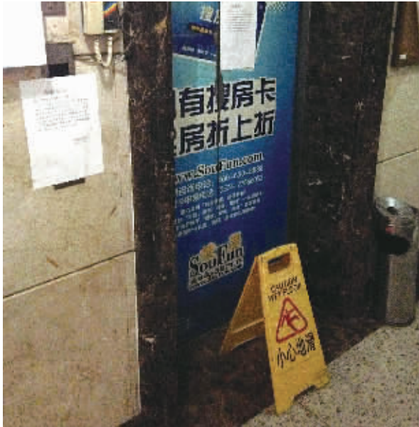
电梯停运半月,住户揪心。