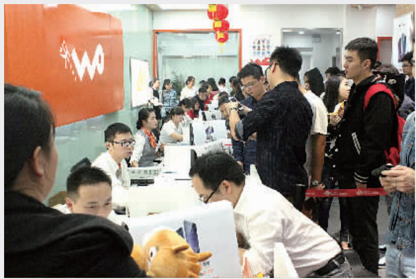
10月17日凌晨,在宁波联通江东百丈营业厅,用户争相抢购办理iPhone6/Plus。

火灾隐患令不少网友担忧升级:现在连裤兜也容不下它了!“弯曲门”还未消停,iPhone6的另一项“新功效”更让人大跌眼镜:闪亮变身新一代“脱毛神器”!网友“Peavler”常抱怨自己的头发被卡在铝材质手机外壳和玻璃屏幕之间:“不但我的头发遭殃,有时我的胡子也会被狠狠地扯掉。那感觉简直是痛彻心扉啊!”