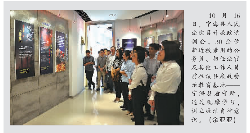
10月16日，宁海县人民法院召开廉政培训会，30余位新任近被录用的公务员、初任法官及其他工作人员前往该县廉政警示教育基地——宁海看守所，通过观摩学习，树立廉洁自律意识。(余亚亚)