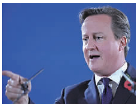
10月24日,在比利时布鲁塞尔欧盟总部,英国首相卡梅伦出席欧盟峰会后的新闻发布会。

卡梅伦记者会期间表情愤怒,激动时用手猛敲桌子。他透露,自己一天前才得知这笔“摊派”费,第一反应就是“彻底愤怒”。他警告,欧盟这种做法可能威胁到英国留在欧盟的前景。