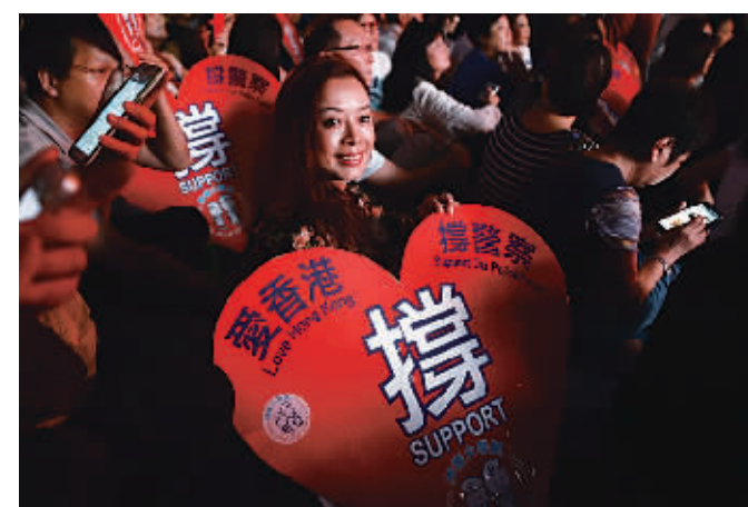
10月25日,参加晚会的市民表达支持警察的心声。当日,香港“蓝丝带运动”“撑警大联盟”等组织在尖沙咀码头广场举办“祝福香港”烛光晚会,不少市民参与并表达祝福香港,支持警方的心声。

包括香港中华总商会、香港中华厂商联合会、香港总商会、香港工业总会及香港中华出口商会在内的五大商会日前呼吁,“占中”已到了失控的边缘,示威人士必须尽快撤离,还市民生路和马路,支持警方依法维持香港社会秩序,令香港尽快恢复稳定繁荣。