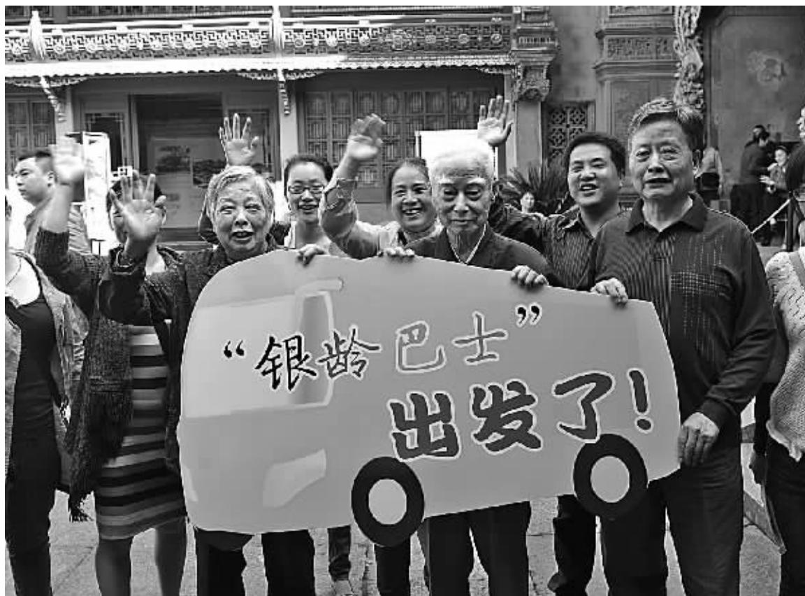
前天,江东庆安社区“银龄巴士”助老公益项目启动仪式在庆安会馆举行。该活动是针对辖区80岁以上孤寡和独居老人外出机会少,精神生活匮乏而考虑的。旅游服务单位无偿提供中巴车或出租车,载着老年人领略都市新风景和甬城周边好山好水,活动每两个月开展一次。

具体时刻可通过宁波机场网站(www.ningbo-airport.com)查询,或拨打服务热线81899000咨询,也可关注宁波机场服务的微博“中国机场阳光服务”,了解航空方面各类信息。