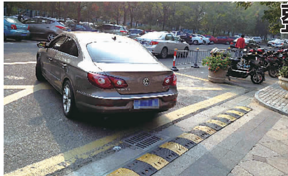
交警设置了隔离栏,扫除了维科上院C区进出处的盲区。