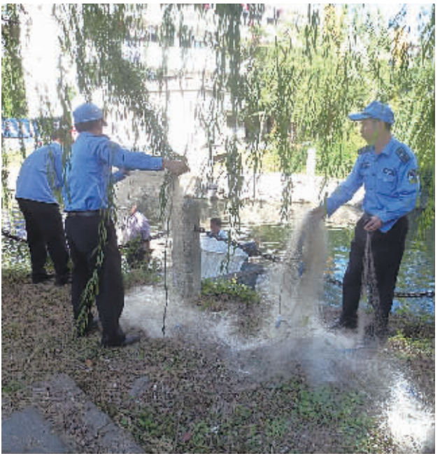
图为执法人员正在查处非法捕鱼。

本报 (记者冯小平 通讯员陈荔) 26日下午,北仑城管执法大队新碶街道中队接群众举报,称有人在新碶街道强一村旁的沙湾河内,采用高密尼龙渔网捕鱼。