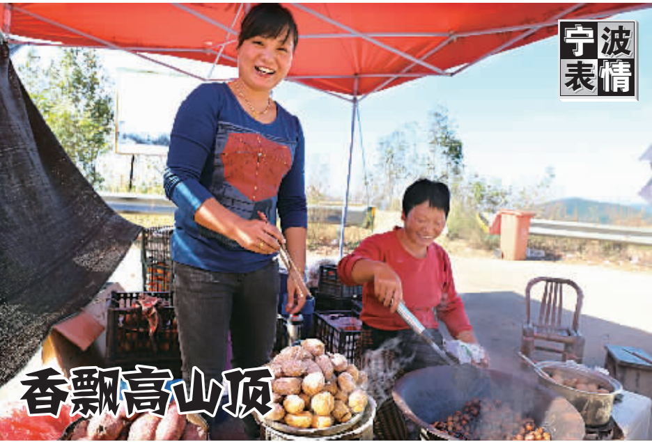
10月26日,在海拔600多米高的余姚市大岚镇夏家岭观景平台上,来自四面八方的游客在这里观赏四明山秋日美景、购买土特产。