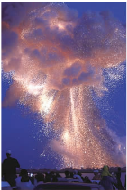
火箭在美国东海岸瓦勒普斯岛上空爆炸的画面。

新华社华盛顿10月28日电（记者林小春）美国轨道科学公司28日向国际空间站发射“天鹅座”飞船，但火箭在点火起飞过程中爆炸。目前，未有人受伤报告。