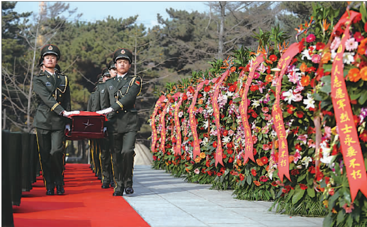
10月29日，礼兵护送志愿军烈士遗骸棺柩入场。