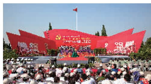
庆祝建党90周年广场诗歌朗诵活动现场

注重整合资源，坚持上下联动，积极与中国文联、省文联、县(市)区文联等共同组织、主办、合办各项活动，成功承办第九届全国水彩、粉画展、“沙孟海奖”第七届全国书法大展，积极筹备第十届中国摄影艺术节，这些活动突出了地域特色，扩大了宁波影响。去年，与中国曲艺家协会、浙江省文联等联合主办中国曲艺牡丹奖获奖节目展演，这是曲艺牡丹奖艺术团在全国的首场惠民演出，巩固汉林、李金斗、曹云金等著名曲艺家为宁波观众献上满堂欢笑。去年，经典文艺活动品牌“春天送你一首诗”首次走出宁波城区来到镇海。支持象山文联编撰《陈汉章全集》27册。积极组织青年作家研讨会、改稿会，支持、推动各县(市)区文联培养、推介文艺家。