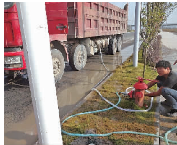
图为工程车正从消防栓上非法取水。

本报讯(记者冯小平 通讯员陈荔)日前,在北仑梅山保税港区有两辆工程车涉嫌通过消防栓偷水,被当地的城管执法人员逮了个正着。