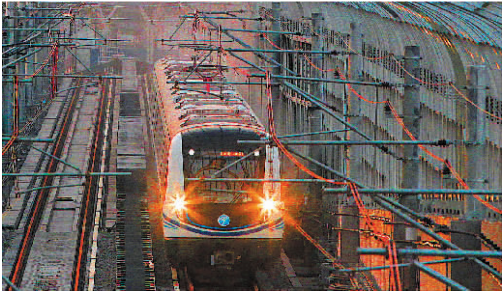
在经济新常态下,我市财税部门全力支持我市重大项目和民生保障。图为我市轨道交通1号线通车前夕。