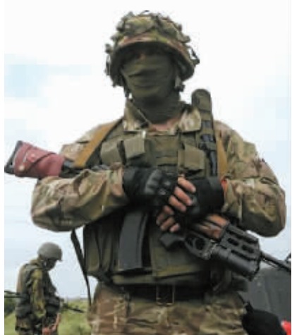
乌克兰政府军士兵在东部地区加强戒备。

亚采纽克补充说,如果现在继续向东部两州拨款经费,就相当于直接资助恐怖主义。“恐怖分子应该离开这片领土,俄罗斯应该停止支持他们。”他说。