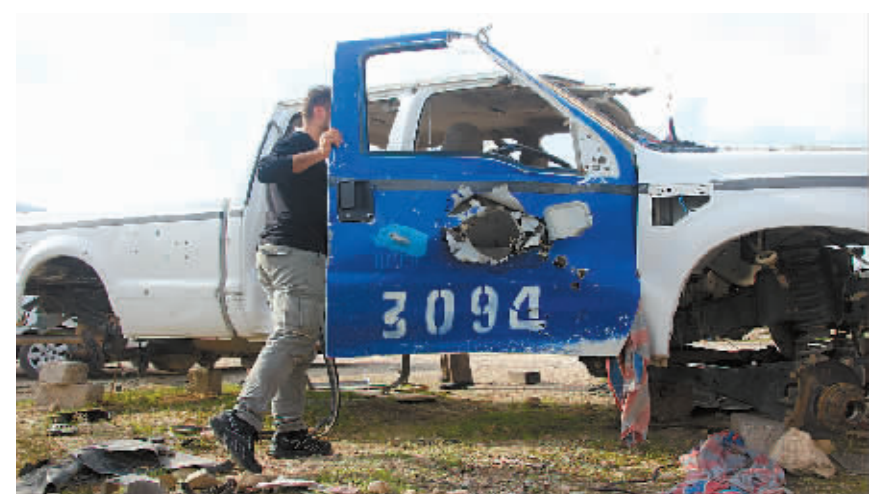
11月3日,在伊拉克北部尼尼微省的摩苏尔水坝,一名库尔德武装士兵检查此前与“伊斯兰国”武装分子作战时被毁的车辆。

奥巴马还警告说,现在谈论是否赢得针对“伊斯兰国”的军事行动为时尚早。美国与盟国当前的首要目标是把该组织逐出伊拉克,削弱该组织在叙利亚重新补给和输送作战人员的能力,最终重建伊叙边境。