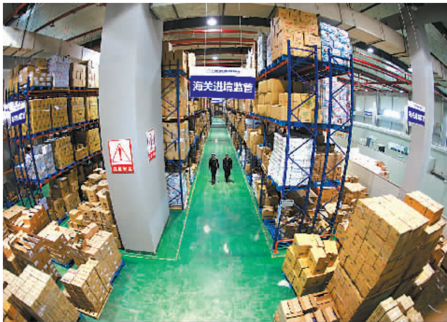
宁波保税区跨境专用仓库“双十一”备货充足。

10月29日,来自美国零售巨头Costco(好市多)的一批货值为26万美元的美国蔓