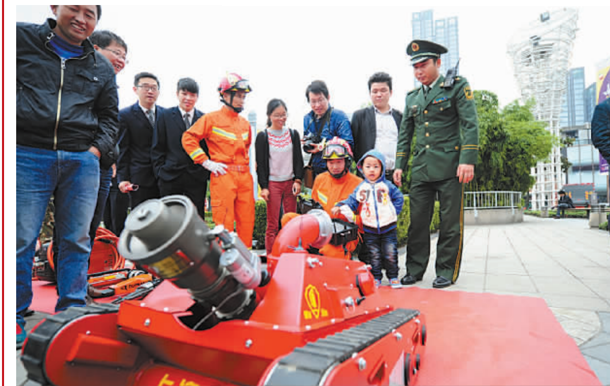
广场上展示的灭火“神器”吸引了众多市民关注。