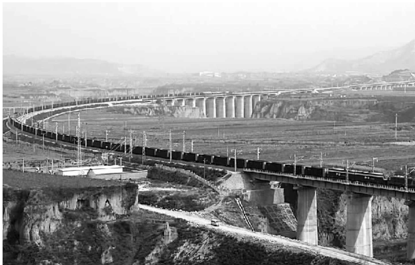
11月6日,我国首条30吨轴重重载铁路成功通过1.2万吨重载试验。