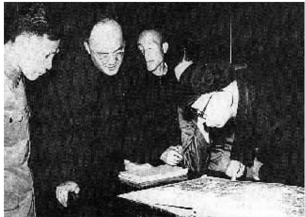
刘少奇参观天一阁藏书楼。