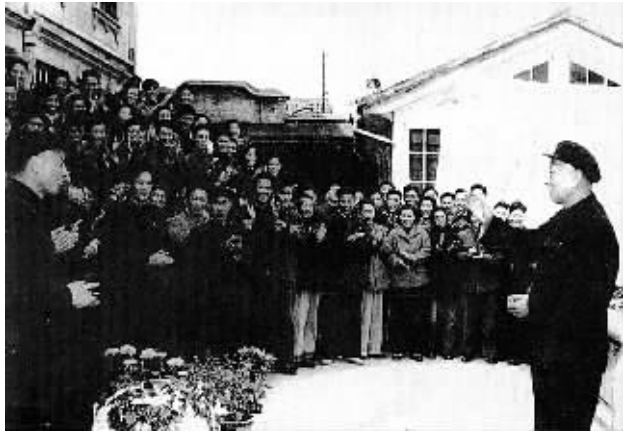
1958年11月5日，刘少奇接见宁波地、市委局以上领导干部。

当日，刘少奇离开宁波去杭州，在火车上继续同林乎加谈话，指出：虚报浮夸当然不好，有些地方一下子搞不准是难免的，但是故意假报就不好，现在许多地方的产量都要打折扣。报纸登的不符合实际，不能全怪报纸，是地委、县委报的，地委、县委书记签过字的，是干部作风问题，对于这种作风要批评。中国是计划经济，经济的工具是统计数字，如果统计不可靠，计划也就不可靠了。要反对说假话，反对这种虚报浮夸的作风，要踏实一点。