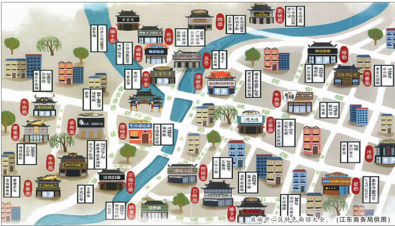
口味好，组委会成员走遍江东、海曙、江北、鄞州等中心城区的大街小巷，点击搜集热心网友的“宝典”，集齐了26家宁波中心城区的特色面店。中兴路上的老北京饭馆、彩虹北路上的避风塘云吞面、南塘老街上的奉化牛肉面、镇明路上的仓桥面结店、环城北路上的宜宾燃面、学府路上的长安面馆……有没有你过去的记忆？有没有你落下的脚步？

今年美食节，围绕食材、食物的文化活动匠心独运，给参观者留下了深刻的印象。宁波是个面食流行的城市，近年来随着开放度的增加，四川担担面、武汉热干面、日本乌冬面等面食纷纷进入宁波。哪家店铺卖什么面、哪家面店