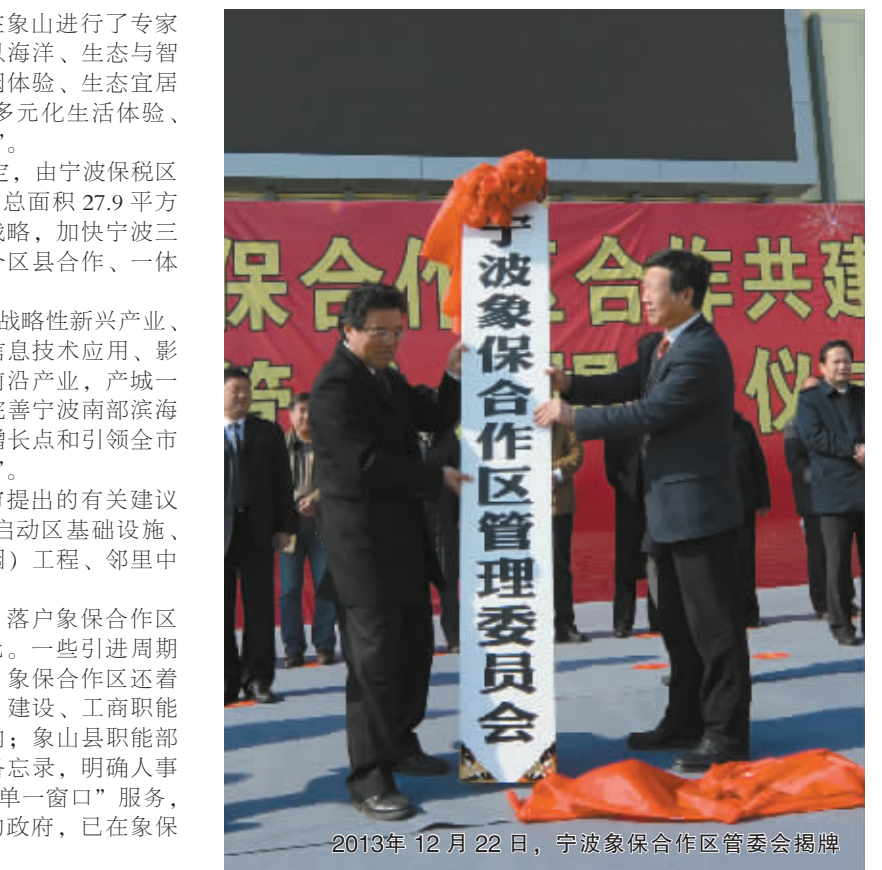
2013年12月22日,宁波象保合作区管委会揭牌

合作区招商工作火热进行中。目前,落户象保合作区的企业已达19家,注册资本合计15亿元。一些引进周期较长的高端生产型项目也在积极跟踪中。象保合作区还着力创新政府管理方式,宁波保税区经贸、建设、工商职能和象山县国税、地税等职能已延伸到区内;象山县职能部门与宁波保税区相关职能部门签署合作备忘录,明确人事劳动、财政、规划、国土等工作模式。“单一窗口”服务,并联审批,全程代办……一个高效服务的政府,已在象保合作区显现雏形。