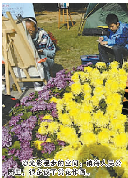
光影漫步的空间; 镇海人民公园里, 很多孩子赏花作画。