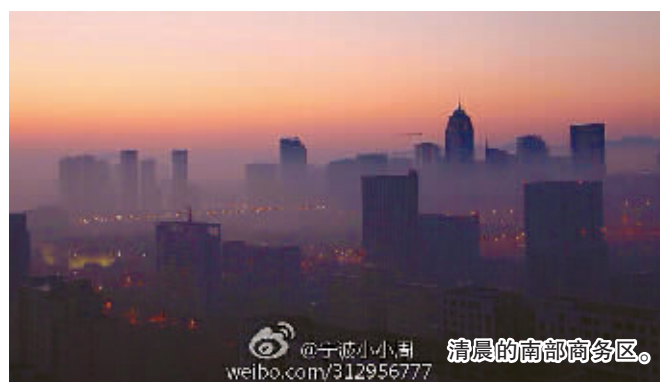
清晨的南部商务区。