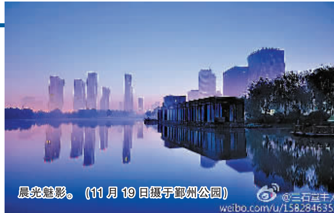
晨光魅影。(11月19日摄于鄞州公园)

本周六将迎来二十四节气中的小雪。过了该节气, 气温日渐下降, 不过大地尚未过于寒冷, 清晨, 雾锁雨城, 构成特有的城市魅力。