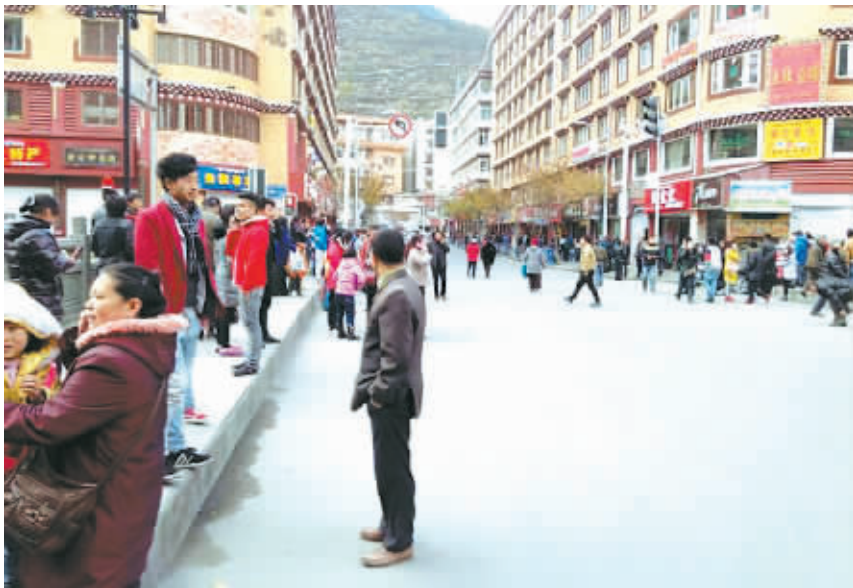
11月22日,居民在康定街头的空旷地躲避地震。