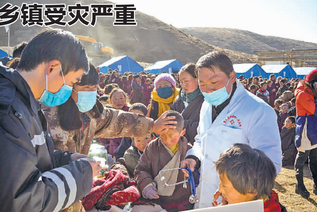
这是木雅祖庆学校的小学生在接受身体检查(11月23日摄)。当日,记者实地走访康定县塔公乡多拉村木雅祖庆学校,在现场看到该校校舍楼体外墙垮塌严重,主体结构无大部,师生已全部转移至校舍楼前空地,食宿无忧。

由于康定地区很多地方是山区、牧区,群众有散居的特点,此次地震造成的相关损失统计难度颇大,目前仍在进行统计中。