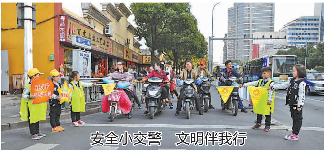
“过马路请走人行道”、“请不要闯红灯”……11月22日下午,江东区百丈路与曙光路口来了一批“小交警”,他们身穿志愿者服装,协助交警叔叔有板有眼地指挥着交通。原来是宁波艺术实验学校102班的学生们正在进行文明劝导志愿者行动!当天下午,小朋友们还清洁了附近的公用自行车,身体力行地参与到文明城市建设中。(通讯员 毛孝钢)

成效显著。 近年来,海曙区国税局在天一商圈、海曙地税局、行政审批服务中心、海曙区部分街道楼宇等地设立7个自助办税网点,放置12台自助办税终端,打造了“15分钟路程自助办税圈”,有效降低了纳税成本。