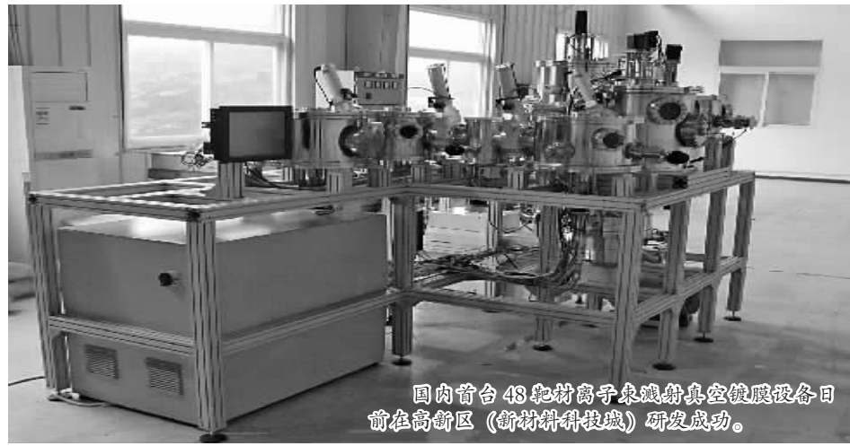
国内首台48靶材离子束溅射真空镀膜设备日前在高新区(新材料科技城)研发成功。

业内专家指出,材料基因组项目“扎根”高新区(新材料科技城),不仅为我市注入了国际领先的新材料研发实力,也将提升我国在材料领域的核心科技水平与工业制造能力,为我国材料研发实现“弯道超车”打下坚实基础。