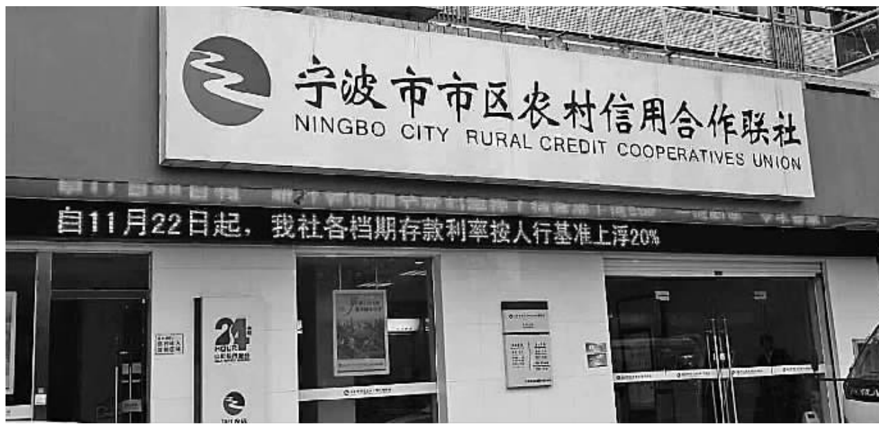
多家银行机构开始加强本次存款利率调整的宣传攻势。