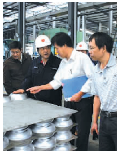
宁波市安监局检查涉可燃爆粉尘企业安全生产

我市严格落实“党政同责、一岗双责、齐抓共管”工作原则和“三个必须”工作要求，改革安全生产领导体制，探索安全生产社会参与机制，推进安全生产行政执法规范化建设，努力提高安监干部的综合素质能力，完善治理工作机制，为做好新时期安全生产工作提供了源动力。