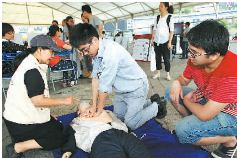
市民在志愿者的指导下学习急救知识

应急管理水平持续提升。规范应急预案管理，高危行业企业预案备案率100%；组建专业应急救援队伍，“以公安消防为主，各部门协同，社会力量补充”的应急救援体系基本建立；提高员工技能，连续五年举办危化企业员工应急处置技能大赛，事故先期处置成功率明显提升；开展应急演练，由应急“演戏”向实战演习转变。