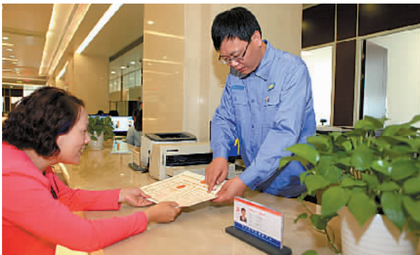
宁波市安监局为市民提供细致的行政审批服务