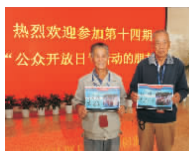
公众代表参观后留言