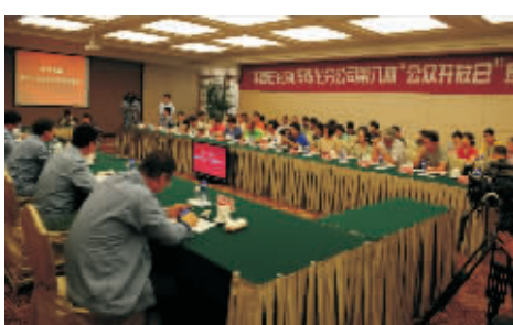
公众代表与镇海炼化工作人员座谈交流