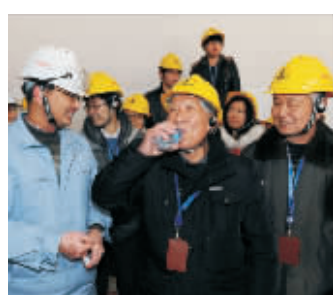
公众代表品尝处理后的清静“废水”