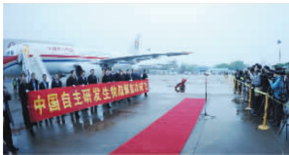
2013年4月24日，镇海炼化生物航煤试飞成功