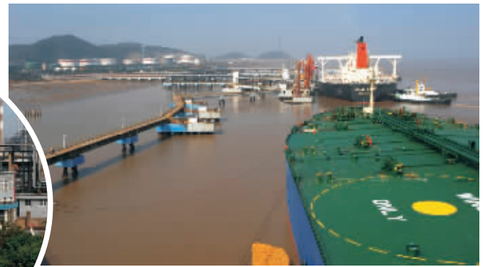
4500万吨/年深水海运码头吞吐能力