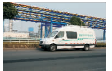
国内首台投入使用的毫秒级在线质谱环境流动监测车走出厂区实时环保巡查