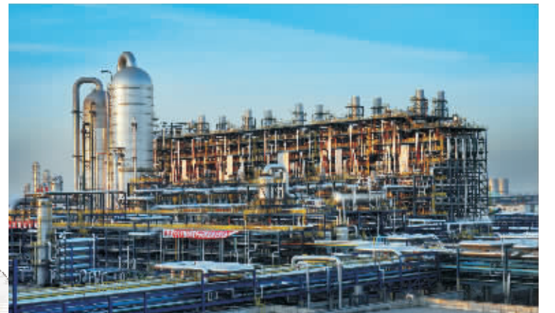
100万吨/年乙烯生产能力