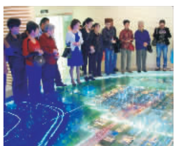
公众代表参观公司展厅

镇海炼化设立制度化、常态化的“公众开放日”，开门迎“客”，增进理解与信任。2013年1月至今，共举办“公众开放日”57期，超过2700名的社会公众先后走进镇海炼化，“零距离”接触镇海炼化，亲历绿色低碳发展带来的碧水蓝天。