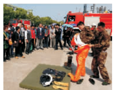
公众代表观看消防队员的精彩演练