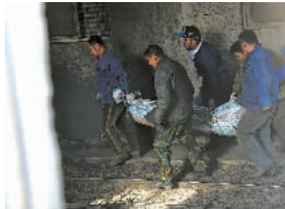
11月26日，工作人员在搬运遇难者遗体。

据新华社沈阳11月26日电（记者王炳坤）辽宁阜新矿业集团恒大煤矿26日凌晨发生煤尘燃烧事故，已造成26人死亡、52人受伤。目前伤员救治工作正紧张进行，对死亡矿工的善后工作也在有序开展。