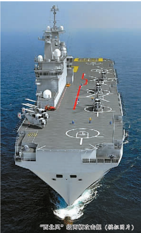
“西北风”级两栖攻击舰（模拟图片）

“西北风”级两栖攻击舰是法国研制的第四代两栖攻击舰，长199米、宽32米，满载排水量2.1万吨，具备远程兵力投送及两栖作战指挥能力，可搭载直升机、水陆两栖装甲车、坦克等重型装备以及900名士兵。