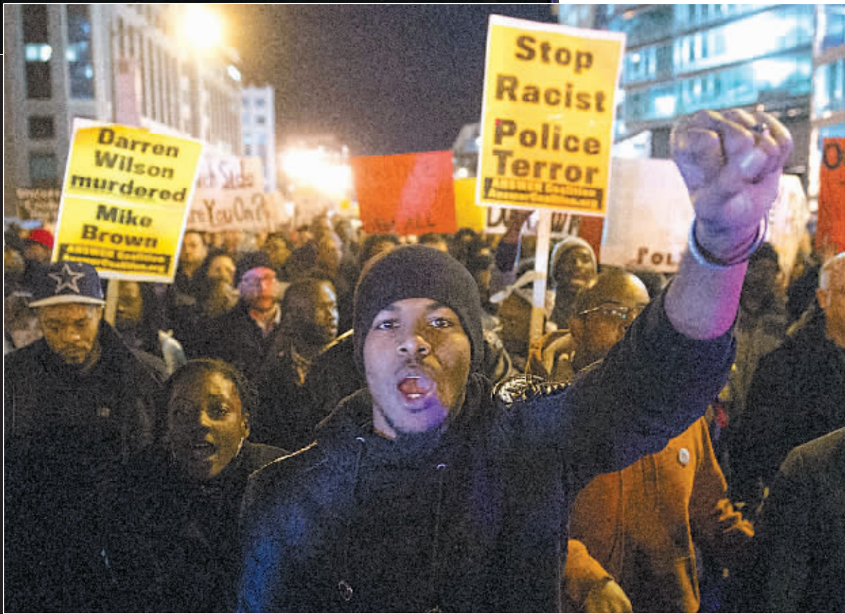
11月25日，示威者在圣路易斯街头呼喊口号，抗议弗格森事件中陪审团作出的不起诉涉事警察的决定。

一些美国法律专家认为，警察执法中何谓“侵犯人权”的界定极为困难，因此定罪的情况并不多见。致力于推动种族平等的美国“种族前进”组织一针见血地指出，对于弗格森枪击案，人们在谴责个人的行为时，更要致力于解决美国“制度性的种族歧视”，因为正是结构性的种族歧视造成了警方和社区间大量的种族不平等。