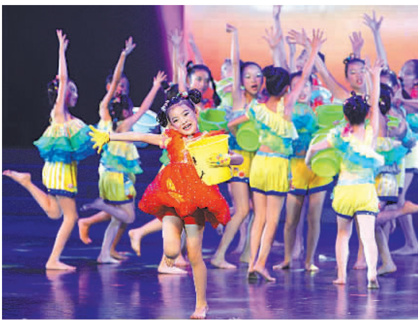
图为演出现场。

本报讯(记者周燕波)昨天,“中国梦·美丽宁波”——“水之韵”主题文艺汇演选拔赛在宁波逸夫剧院落下帷幕。在26日至27日为期两天的选拔赛上,36个由市级机关及各县(市)区代表队精心编排的文艺节目精彩亮相,为观众呈现了一场以“五水共治”为主题的特色文艺晚会。宁波是一个因水而美,因水而富的城市。在昨、前两天晚上举行的文艺汇演比赛中,节目内容十分丰富,有歌舞、小品、甬剧、快板、走书、音乐情景剧及器乐演奏等。记者发现,演出的36个文艺作品中,光题目中带有“水”、“江”、“河”等与水有关眼的节目就多达19个,如《水香陈婆渡》、