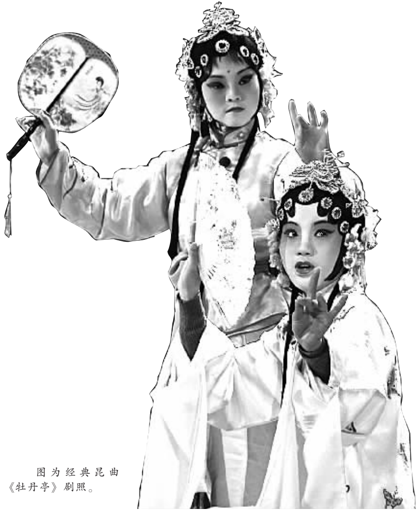
图为经典昆曲《牡丹亭》剧照。

据新华社电（记者李丹）11月27日至29日，北方昆曲剧院、上海昆剧团、浙江昆剧团、江苏省演艺集团昆剧院、江苏省苏州昆剧院、湖南省昆剧团、永嘉昆剧团七大昆剧院的青年演员会聚柳州，参加全国昆曲优秀青年演员展演活动。通过越来越多青年演员的传承，昆曲这门600年历史的古老艺术焕发时代光彩。