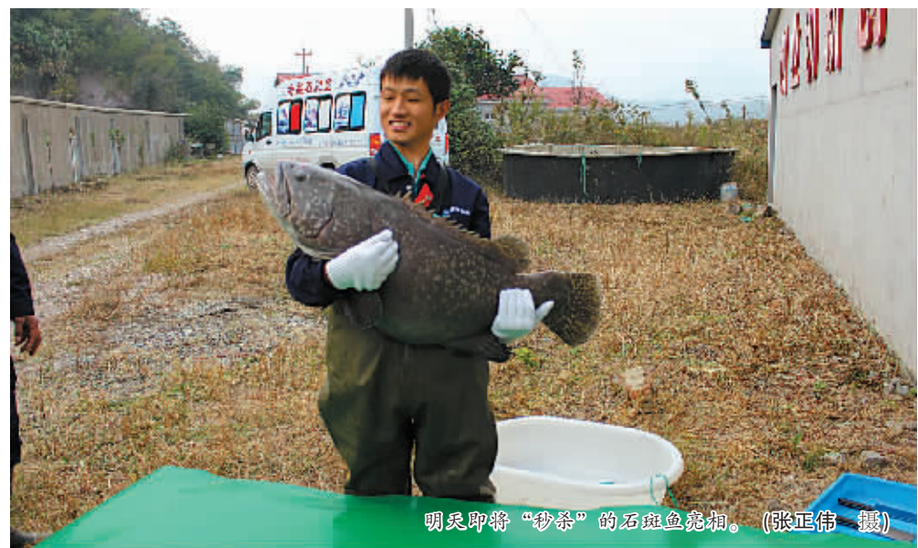
明天即将“秒杀”的石斑鱼亮相。

淘宝·特色中国宁波馆是市供销社与淘宝网全面合作，淘宝官方唯一授权的宁波农特产品电子商务服务平台，今年9月16日正式开馆以来，销售额已经突破3000万元。其中海鲜是它的最大特色，开馆“东海第一网”成交额1400万元，“双十二”销售额1000万元，正朝着淘宝“海鲜第一馆”的目标稳步前进。（记者 张正伟 通讯员 刘波）