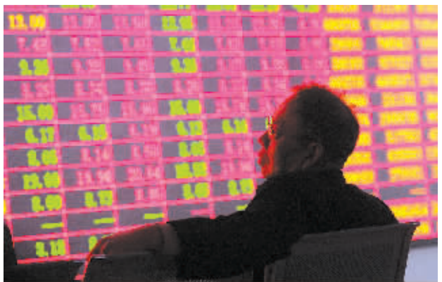
12月2日，一位股民在一家证券营业厅内关注股市行情。

尽管11月股市超预期，但由于12月政策放松叠加货币宽松的逻辑延续，改革红利、高送转及泛并购重组等多个热点将活跃市场，申银万国判断股指有望维持震荡上行格局，并留意投资者过度亢奋透支所引发的股指短期震荡。（据新华社）