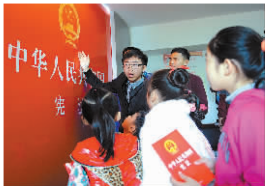
鄞州区钟公庙街道后庙社区近日邀请律师事务所律师为小学生和部分大学生讲解《中华人民共和国宪法》的基本常识,并回答了学生们提出的问题。

宪法的生命和力量,本质上来源于全体国民对它的深深信仰和至高尊崇。我们期待,以宪法日为开端,真正让宪法“热”起来、“灵”起来,一天深入人心,让人们尊崇、信仰和敬畏,树立起应有权威,开启依法治国新时代。