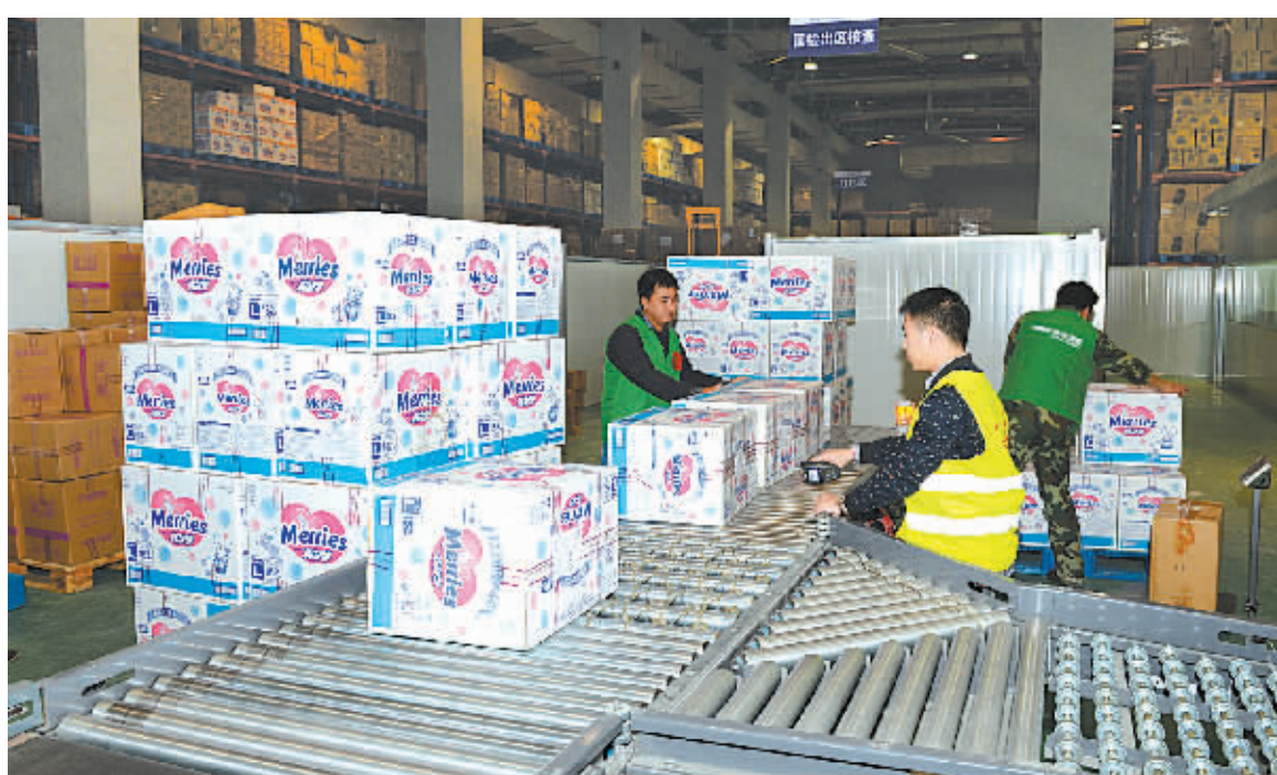
迎战“双十二”,宁波保税区跨境电商仓库内一片繁忙。

宁波保税区管委会还出台多项配套扶持政策,吸引国内外电子商务企业落户发展。目前已累计引进电子商务企业230多家。此外,宁波保税区还与阿里巴巴天猫国际、国内首家引进海外零售商的跨境购物网站洋码头、中国最大的进口母婴品牌限时特卖商城蜜芽宝贝、美国第二大零售商Costco(好市多)等平台开展战略合作,初步形成了“垂直电商集聚、平台电商合作”的发展格局。