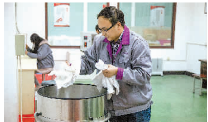
工作人员正在进行产品洗涤、脱水、洗净度等质量指标的检测。(张正伟 徐莹 摄)

此外，自从2008年开启内销市场战略以来，奇帅在服务质量上也是向专业化看齐。2013年，公司在业内创造性实施“1.3.7无忧服务承诺”方案，承诺1小时内回复用户，核实受理信息、维修故障和预约上门服务；承诺3天内上门服务，如推迟，用户可索赔“不及时服务补偿金”；如因配件原因导致3天内未能修复机器，承诺最迟在此后7天内100%修复，否则可无条件退货。公司还引进CRM客户管理系统，不断加大服务网络开发和管理。目前，奇帅在全国构建了6000家售后服务中心，基本实现“产品销售到哪里，售后服务就跟踪到哪里”的目标。