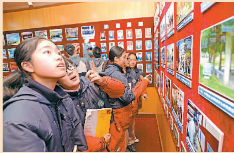
9日下午,在刚装修完毕的鄞州区正始中学校史馆,一批高一学生正在重温学校浓厚悠久的办学历史。本月14日,正始中学将迎来80周年校庆。