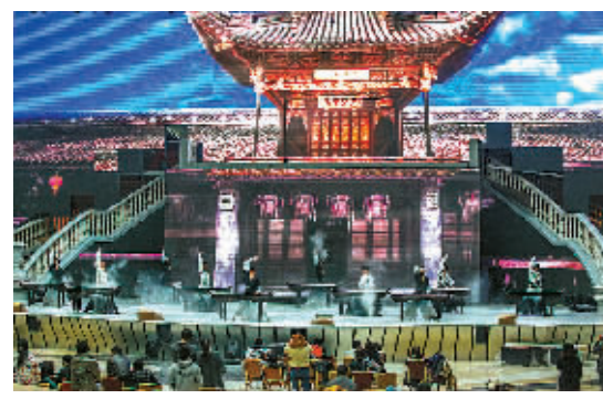
昨天下午,《明秀·大航海》在华珂剧场排演。图为第二幕中的风雨天一阁场景。

本报讯(记者陈朝霞 海曙记者站朱伊莹)昨天,演绎宁波地域文化的剧场秀《明秀·大航海》举行新闻通气会,该剧将于12月29日在华侨豪生大酒店的华珂剧场首演。据悉,这是宁波首个酒店旅游秀,对拉动宁波文化消费、带动“月光经济”发展将发挥积极作用。