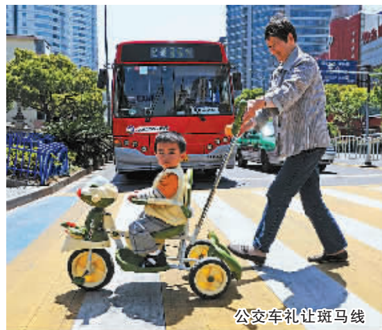
公交车礼让斑马线