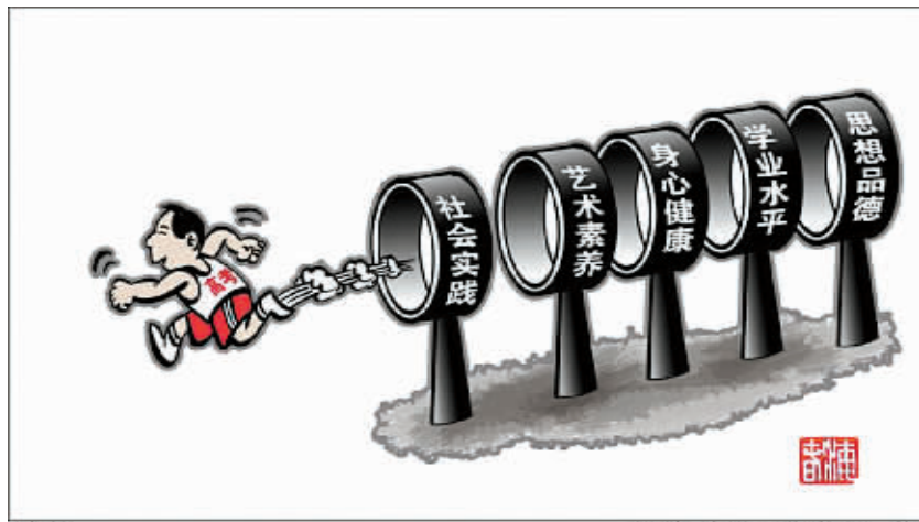
过关 新华社发 商海春 作

针对这类问题,意见对学生思想品德、学业水平、身心健康、艺术素养、社会实践等方面进行了细化,每个方面有不同的考察重点。如在思想