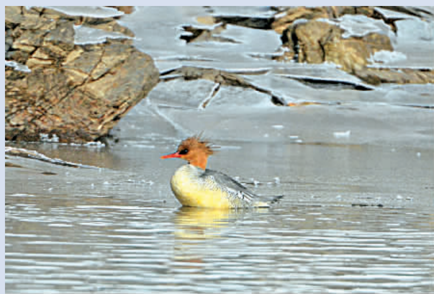
12月21日,被称为“鸟中大熊猫”的中华秋沙鸭在辽宁本溪水洞附近的太子河中戏水。据当地野保部门介绍,中华秋沙鸭为中国特有鸟类,国家一级重点保护动物,已被列入国际濒危物种红皮书和国际鸟类保护委员会濒危鸟类名录。2013年入冬时节,本溪太子河地区发现了几只中华秋沙鸭。2014年冬季,再次在太子河流域发现了它们的身影。(新华社发)

无锡市公安局治安支队七大队负责人介绍,从查获的情况来看,这一非法窝点生产的所谓“保健食品”,其实就是猪饲料加一点降血糖的药粉,搅拌后裹以胶囊,再进行包装。一盒成本不足10元,卖给销售人员的价格却达到98元/盒,而销售人员卖给民众高达398元/盒。