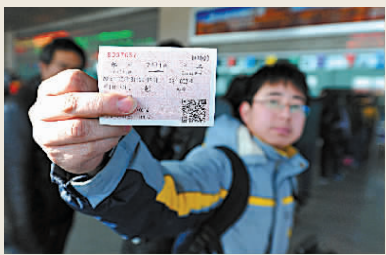
12月21日,在宁夏银川火车站,一位旅客从互联网购票取票处拿到了除夕当天的火车票。当日起,旅客通过互联网和电话可购买除夕(2015年2月18日)的火车票。(新华社记者 彭昭之 摄)

根据目前的车票销售情况看,北京到长沙、广州、武汉、西安以及哈尔滨等方向车票基本售光;上海到武