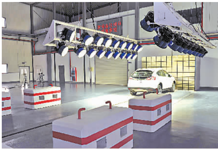
中汽研究中心杭州湾检测基地碰撞试验室。