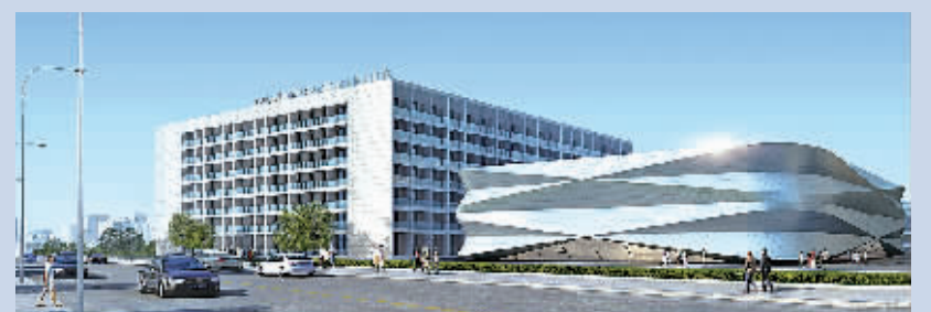
吉利-沃尔沃中国设计及试验中心效果图。

据悉,该项目总投资62亿元,主要建设汽车研发技术中心、汽车试验中心和试制中心项目。其中,汽车研发技术中心项目主要建设整车研究院、汽车动力总成研究院、新能源汽车研究院、汽车创意设计中心等;汽车试验中心项目主要建设国际领先水平的汽车安全技术、汽车发动机、新能源汽车、整车噪声等实验室以及整车转鼓试验室、汽车发动机试验台架、新能源汽车充电站、汽车造型油泥制作中心等实验室;汽车试制中心项目主要建设柔性化新开发车型的试制工厂。项目全部投入运营后,将引进各类汽车研发人员8000人以上,可实现年技术服务营业收入20亿元。笔者从吉利汽车项目现场指挥部获悉,目前先行推进的试制中心,将于明年6月投用。