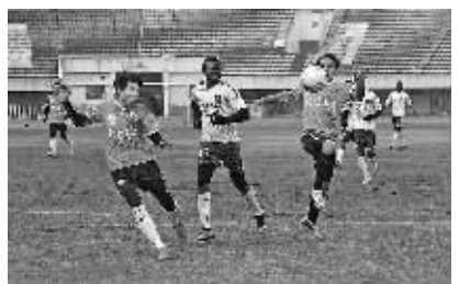
图为比赛中的镜头。

新升机械队获得本次比赛季军,浙江核力小肥羊、宝兴物流、开元棋牌D.P队分获本次比赛的第四至第六名。新升机械队的顾晓伟以7球获得最佳射手称号,圣龙股份和甬鹰队获得体育道德风尚奖。