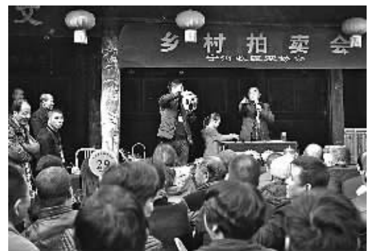
图为乡村拍卖会现场。

据了解,土著收藏协会会员们深感那些藏于民间的众多老物件——比如旧时农村用的竹篮、碗盆、柜子、瓷瓶等,往往随着城市建设和老房子的拆迁而散佚民间,十分可惜。这些饱含着儿时记忆和乡愁的老物件大多算不上文物,却又有别样的文化价值,体现着老底子宁