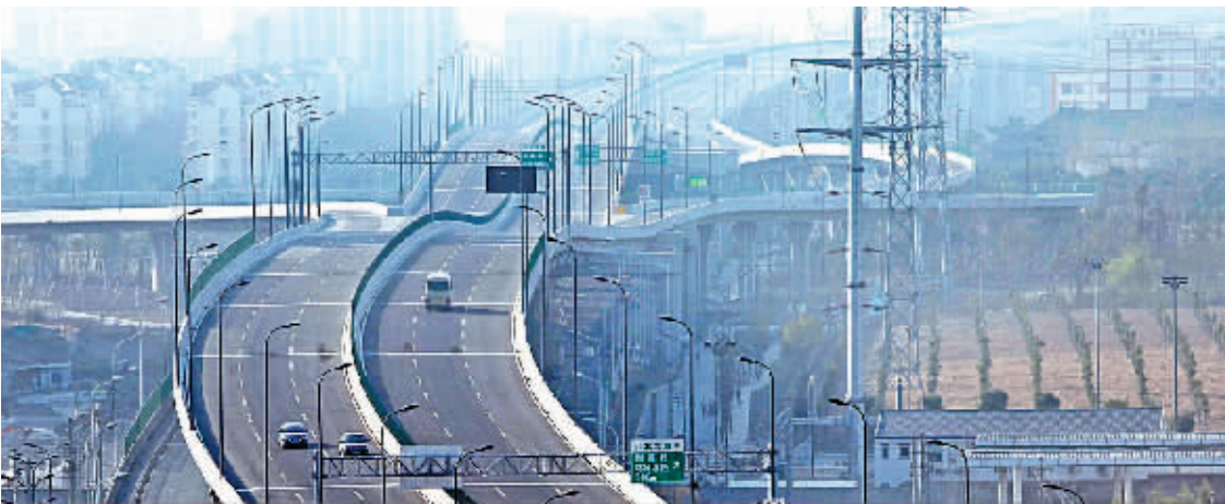
昨天通车的北外环快速路江北区庄桥路段。