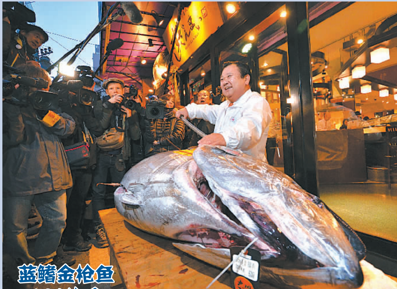
蓝鳍金枪鱼 180公斤 450万日元

欧盟担心乌克兰加入北约造成难以控制的风险。德国、法国对乌克兰打算通过公投加入北约的计划都保持警惕,认为这将加剧紧张局势。德国总理默克尔指出,让乌克兰加入北约和拉近北约-乌克兰关系之间有着质的不同。(据新华社北京1月5日电)