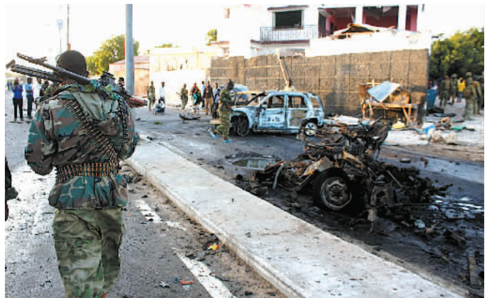
1月4日,在索马里首都摩加迪沙,索马里安全人员在汽车炸弹袭击现场巡逻。