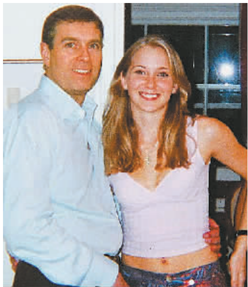
2001年安德鲁王子与罗伯茨的合影。