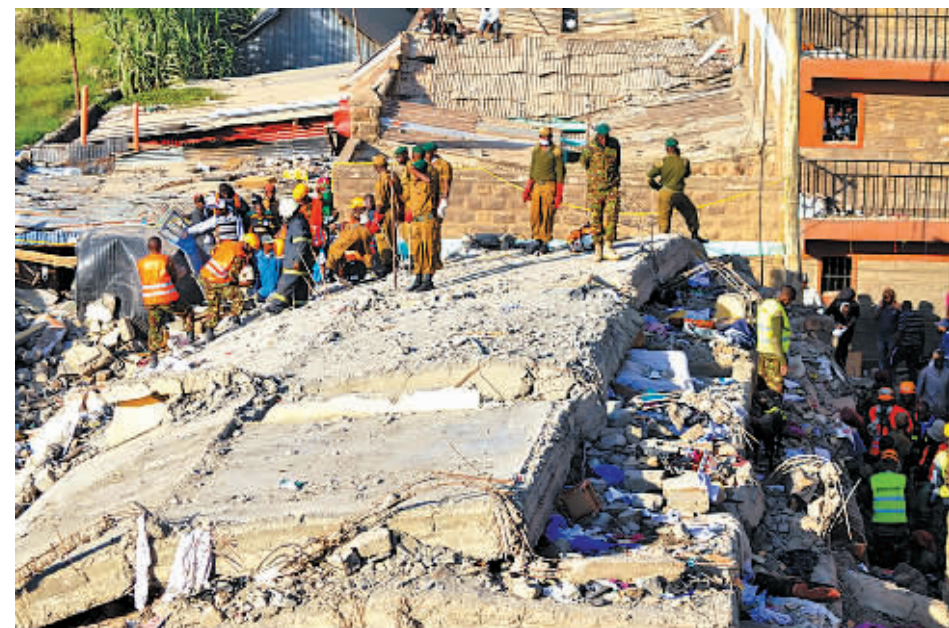
1月5日,在肯尼亚首都内罗毕,救援人员在坍塌住宅楼的废墟上搜寻幸存者。